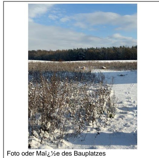
Foto oder MaÃ¼Ã¼e des Bauplatzes