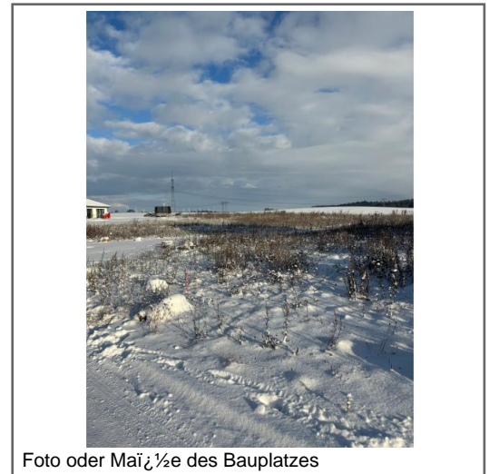
Foto oder MaÃ¼Ã¼e des Bauplatzes