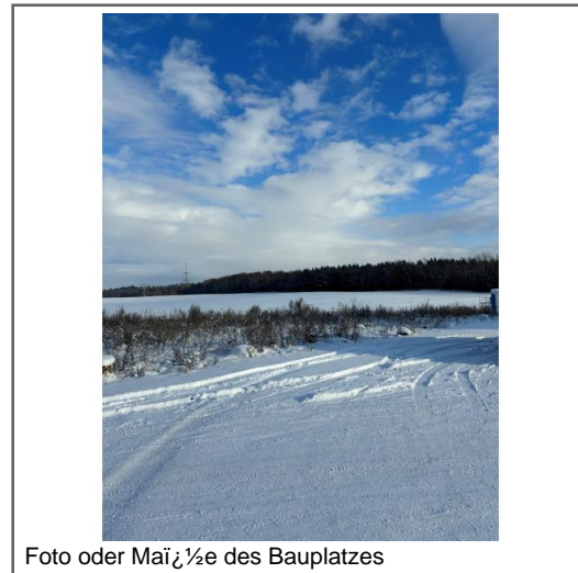
Foto oder MaÃ¼Ã¼e des Bauplatzes