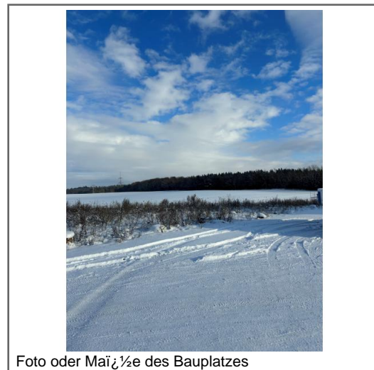
Foto oder MaÃ¼Ã¼e des Bauplatzes