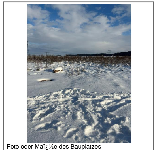
Foto oder MaÃ¼Ã¼e des Bauplatzes