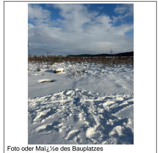
Foto oder MaÃ¼Ã¼e des Bauplatzes