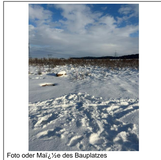
Foto oder MaÃ¼Ã¼e des Bauplatzes