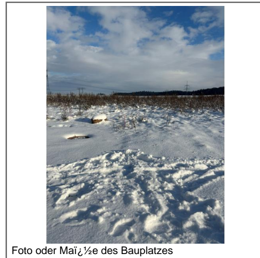
Foto oder MaÃ¼Ã¼e des Bauplatzes