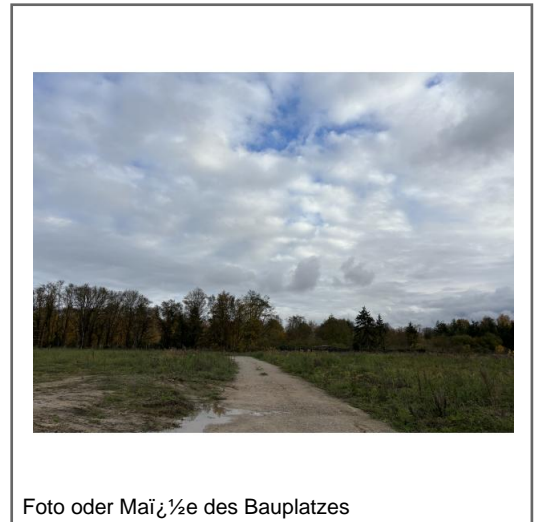
Foto oder Maiç½e des Bauplatzes