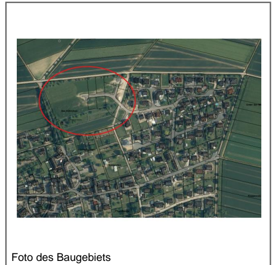
Foto des Baugebiets