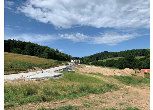
Foto des Baugebiets