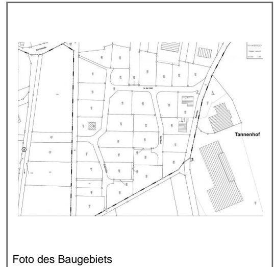
Foto des Baugebiets