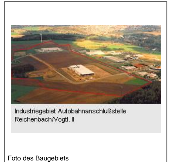
Industriegebiet Autobahnanschlußstelle Reichenbach/Vogtl. II