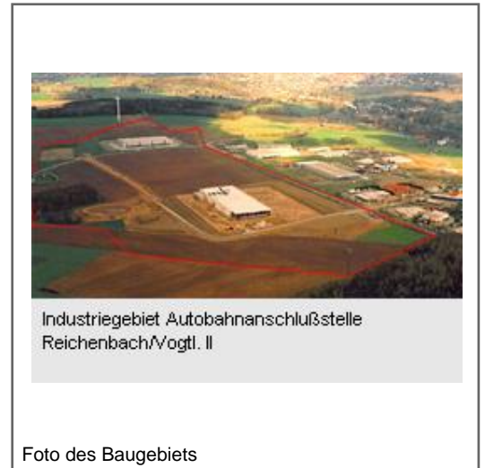
Industriegebiet Autobahnanschlussstelle Reichenbach/Vogtl. II