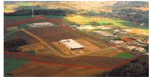
Industriegebiet Autobahnanschlussstelle Reichenbach/Vogtl. II