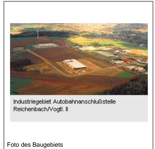
Foto des Baugebiets