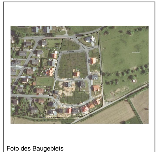
Foto des Baugebiets

Das Wohnbaugebiet "Auf dem Kreuzacker" liegt am Ortsrand des Stadtteiles Rainrod, ca. 5 km südlich der Kernstadt Schotten. Am Ortsrand von Rainrod mit teilweiser Hanglage genießen Sie Ruhe des Vogelsberges. In ca. 2 km Nähe finden Sie den Nidda Stausee, der eine Vielzahl von Erholungs- und Freizeitmöglichkeiten bietet. Ebenfalls „vor der Haustür“ liegt das Wintersportgebiet des Hohen Vogelsberges.