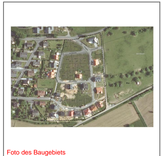
Foto des Baugebiets

Das Wohnbaugebiet "Auf dem Kreuzacker" liegt am Ortsrand des Stadtteiles Rainrod, ca. 5 km südlich der Kernstadt Schotten. Am Ortsrand von Rainrod mit teilweiser Hanglage genießen Sie Ruhe des Vogelsberges. In ca. 2 km Nähe finden Sie den Nidda Stausee, der eine Vielzahl von Erholungs- und Freizeitmöglichkeiten bietet. Ebenfalls „vor der Haustür“ liegt das Wintersportgebiet des Hohen Vogelsberges.