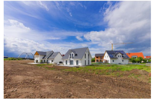
Foto oder MÃ¼Ã¼e des Bauplatzes