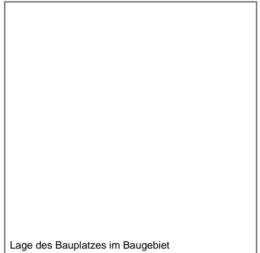
Lage des Bauplatzes im Baugebiet