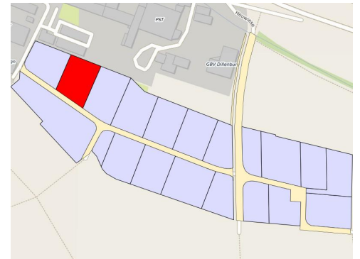
Lage des Bauplatzes im Baugebiet