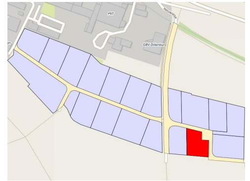
Lage des Bauplatzes im Baugebiet