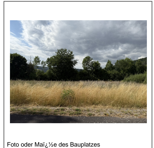
Foto oder Maßç½e des Bauplatzes