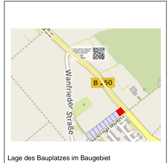
Lage des Bauplatzes im Baugebiet

z.B. SD, WD, PD, bei FD (bis 10 \hat{a} ) Attika max=