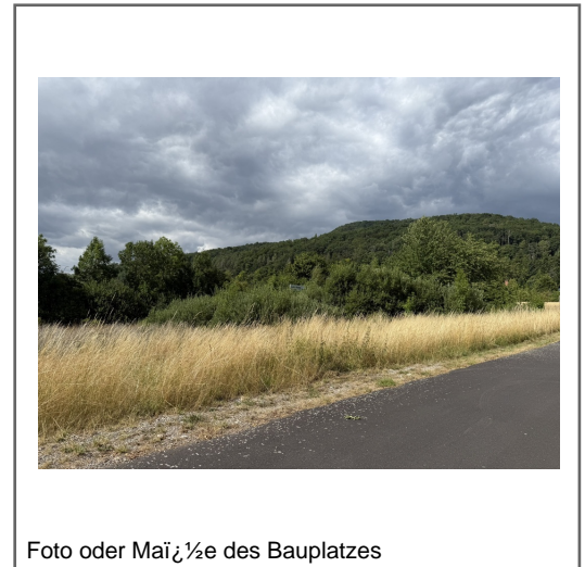
Foto oder Maßç½e des Bauplatzes