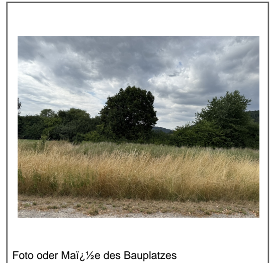
Foto oder Maßç½e des Bauplatzes