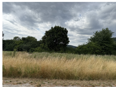
Foto oder Maßç½e des Bauplatzes