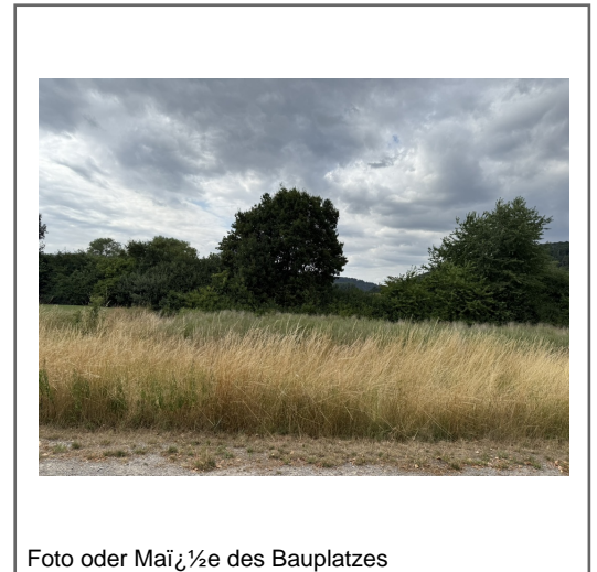
Foto oder Maßç½e des Bauplatzes