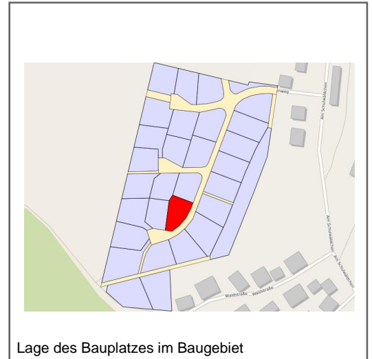
Lage des Bauplatzes im Baugebiet

Im westlichen Bereich von Cornberg befindet sich in landschaftlich wundervoller Lage das Baugebiet "Über dem Schulwäldchen". Dem interessierten Bauherrn stehen hier 28 Bauplätze zur Verfügung. Die Grundstücke sind voll erschlossen und können sofort bebaut werden.