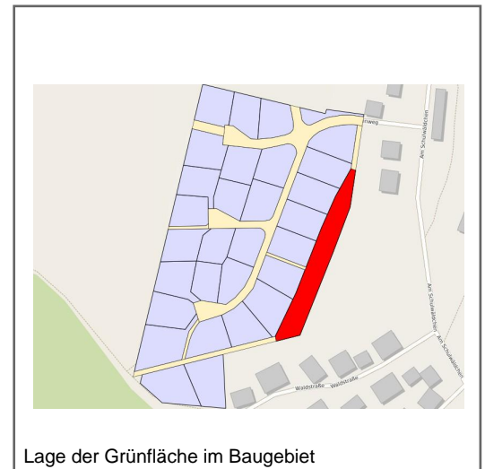
Lage der Grünfläche im Baugebiet

Im westlichen Bereich von Cornberg befindet sich in landschaftlich wundervoller Lage das Baugebiet "Über dem Schulwäldchen". Dem interessierten Bauherrn stehen hier 28 Bauplätze zur Verfügung. Die Grundstücke sind voll erschlossen und können sofort bebaut werden.