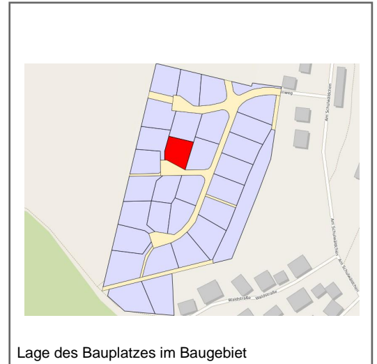
Lage des Bauplatzes im Baugebiet

Im westlichen Bereich von Cornberg befindet sich in landschaftlich wundervoller Lage das Baugebiet "Über dem Schulwäldchen". Dem interessierten Bauherrn stehen hier 28 Bauplätze zur Verfügung. Die Grundstücke sind voll erschlossen und können sofort bebaut werden.