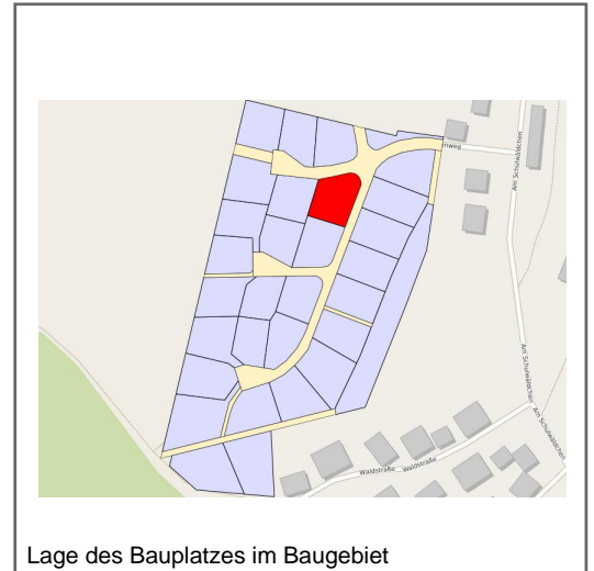
Lage des Bauplatzes im Baugebiet

Im westlichen Bereich von Cornberg befindet sich in landschaftlich wundervoller Lage das Baugebiet "Über dem Schulwäldchen". Dem interessierten Bauherrn stehen hier 28 Bauplätze zur Verfügung. Die Grundstücke sind voll erschlossen und können sofort bebaut werden.