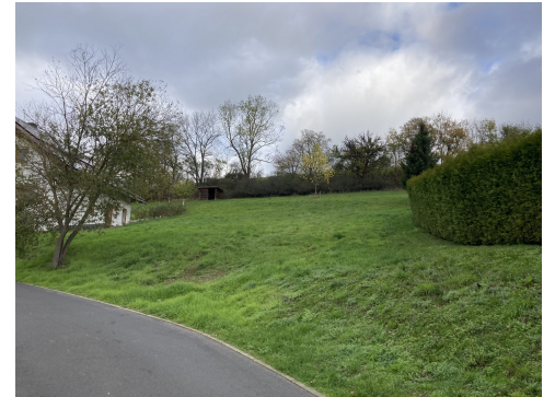
Foto des Baugebiets

Foto oder Ma \frac{1}{2} e des Bauplatzes